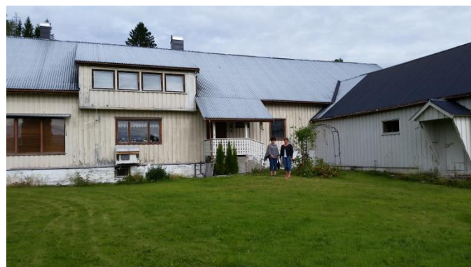
Meierisalen i Øvre Kvam

Nå ventet nye flotte dager både i Bergly og på hytta. Men det får bli en annen historie.