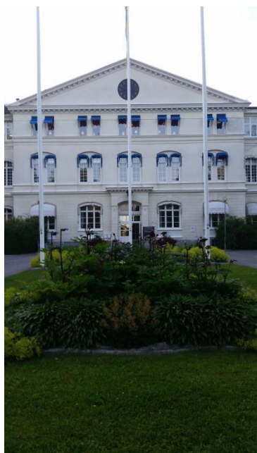
Furunäset i Piteå. Soler oss på terrassen etter en lang tur gjennom «Stora ödet» på Innlandsvägen og E4.