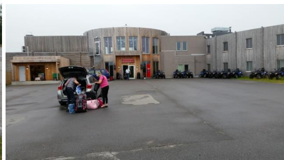
Kafferast på veien til Kautokeino og innsjekking på Thon Hotell.