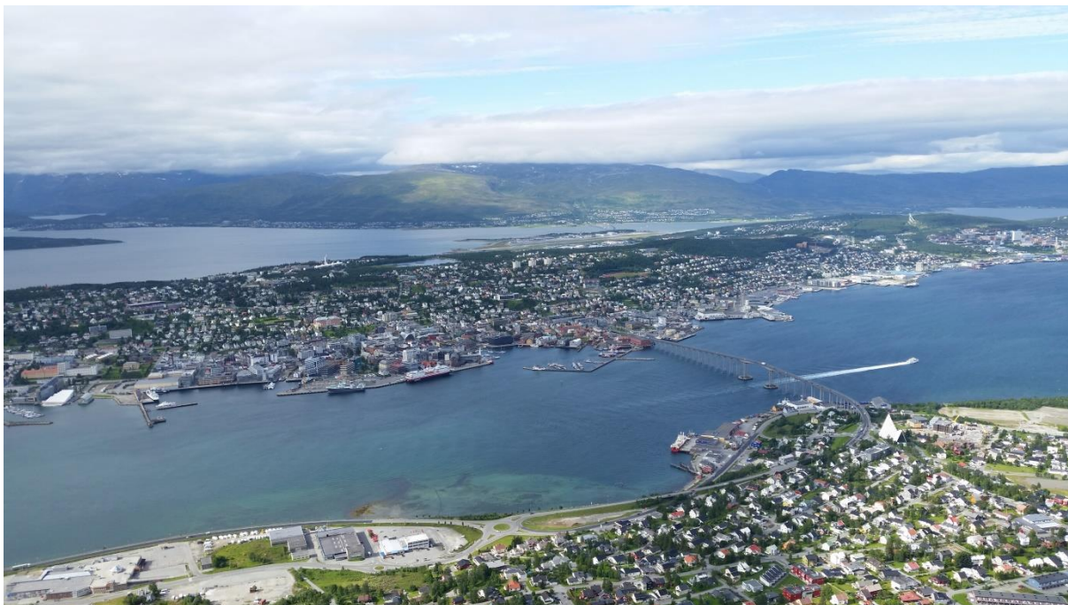
Tromsø er en flott by! Her sett fra Fjellheisen.