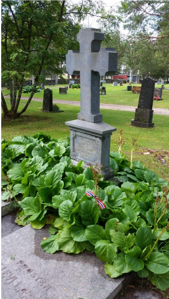
Lars Levi Læstadius (1800-1861) er Pajalas mest kjente person. Gravsted og minnestein ved prestegården ble besøkt. ( Merk norsk sløyfe.)