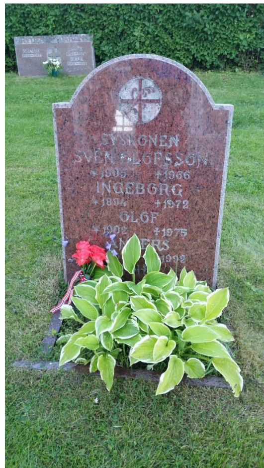
Åsarna gamle kirke og gravstedet til 5 av syskonen Olofsson. «Anders Bortkømmen»s barnebarn.