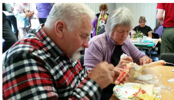
Kongekrabbe på Kunes.